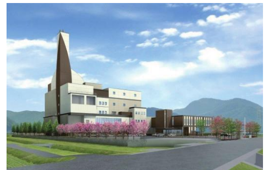
bản vẽ hoàn chỉnh cơ sở xử lý chất thải mới