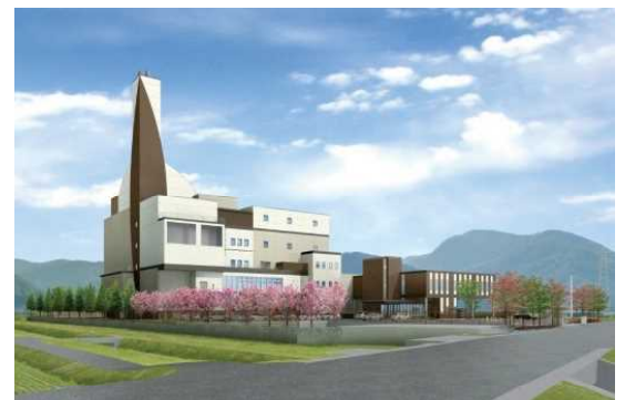
新ごみ処理施設完成図