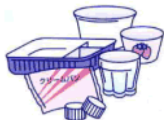
プラスチック製容器包装