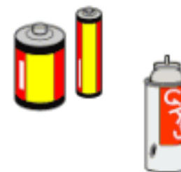
電池・スプレー缶