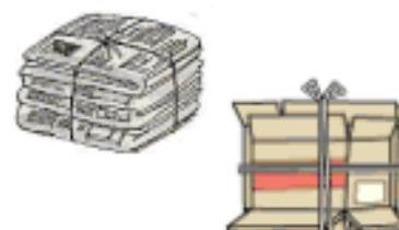
新聞・雑誌、ダンボール